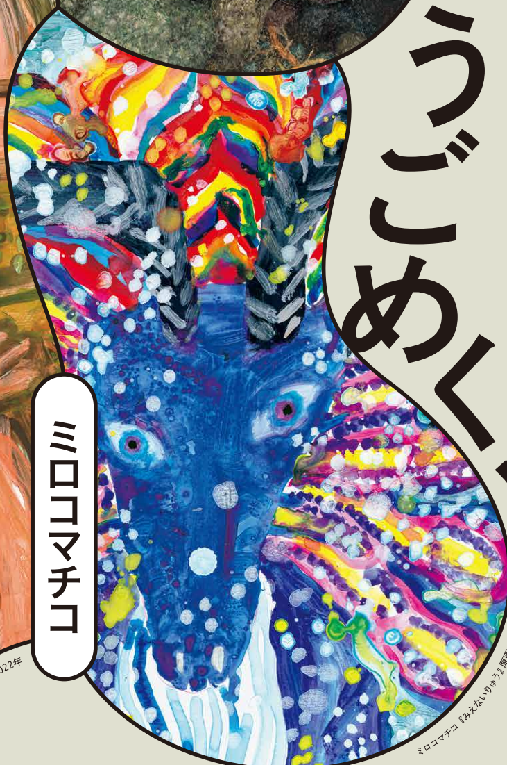
ミロコマチコ『みえないやう』原画(部分) 2023年