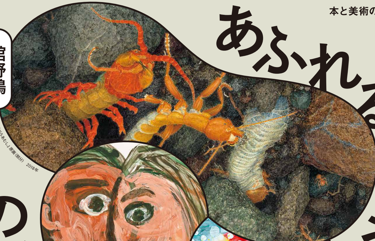
舘野鴻『むしあふれ』原画(部分) 2018年